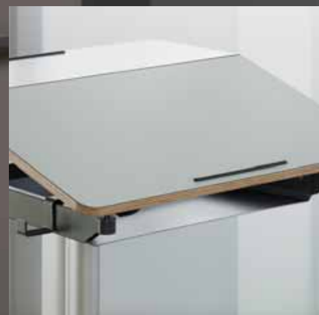
Ablagefach Bac de rangement