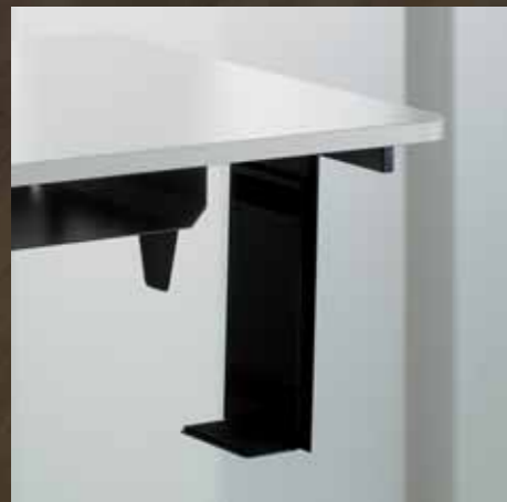
PC-Halter Support PC