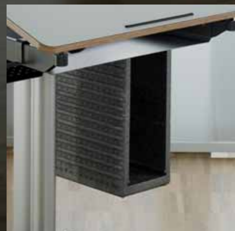
Mobile Ablagebox Box de rangement mobile