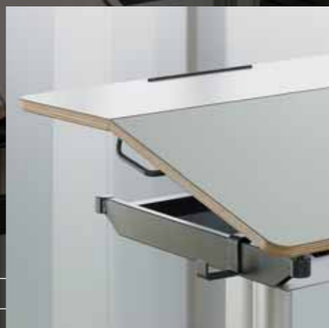
Geteilte neigbare Platte Plateau en deux parties, inclinable