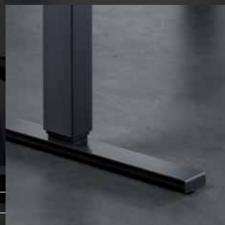
Verstellgleiter/Rollen Patins réglables/roulettes