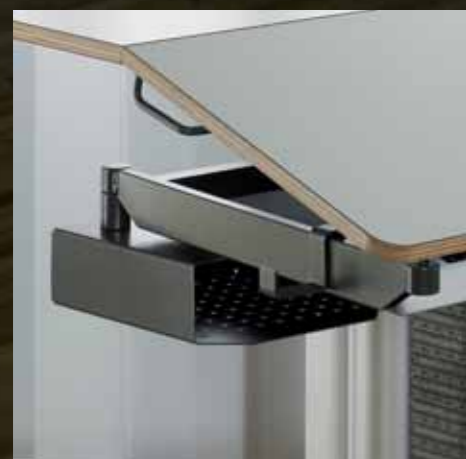
Zusatzfächer Bac de rangement supplémentaire