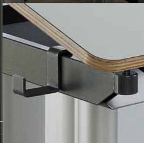
Mappenhaken Crochet à mallettes