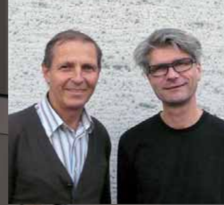
Produktdesign: Ivo Vesely und Roland Eberle

Ein leichter und mobiler Tisch ist das Grundelement des Einrichtungssystems ScuolaBOX. Zusammen mit dem Stuhl ScuolaFLEX lassen sich zukunftsorientierte Bildungsräume mit unterschiedlichen Anforderungen flexibel und ergonomisch realisieren.