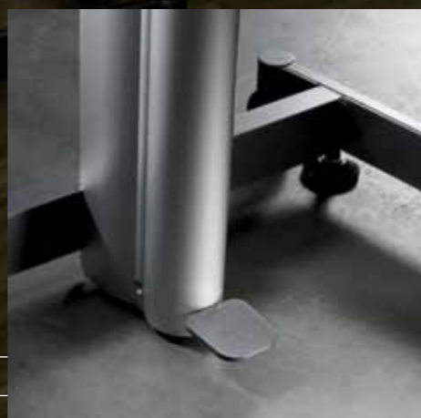
Fusspedal Pédale de réglage