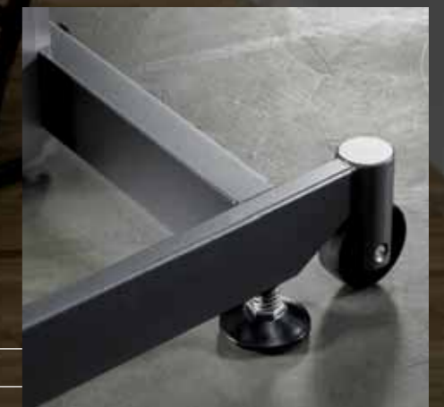
Verstellgleiter/Rollen Patins réglables/roulettes