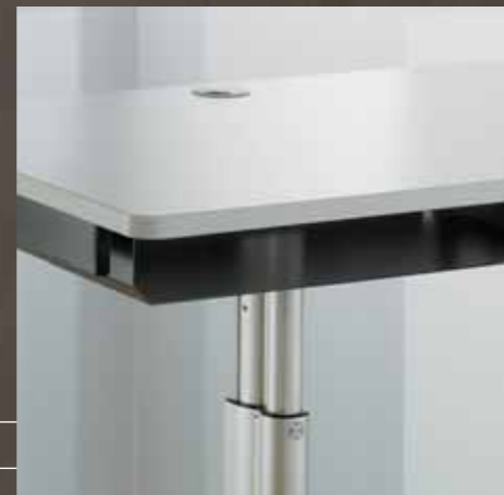
Kabeldurchlass Passage des câbles