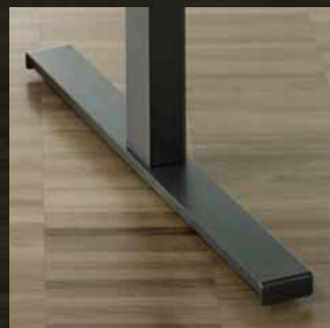
Verstellgleiter/Rollen Patins réglables/roulettes

L'enseignante et l'enseignant deviennent de plus en plus des entraîneurs de la classe. La table de professeur lourde et imposante est remplacé par une place de travail accueillante et flexible.