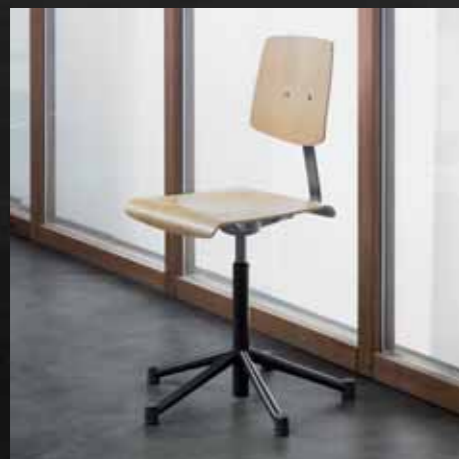
Buche natur Hêtre naturel