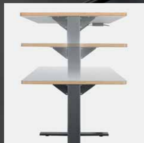
Höhenverstellbar Hauteur réglable

Pour toutes les zones où des tables individuelles ne sont pas l'idéal, p. ex. les salles ACT/ACM ou les salles de groupes, ScuolaBOX propose des tables avec des surfaces plus grandes et avec un réglage à gaz, ce qui permet un travail assis ou debout. Des roulettes intégrées permettent un placement flexible.