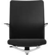
_3 Rücken Polster, Sitz Netz Dossier rembourré, assise résille