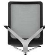
_1 Sitzschale schwarz Coque de siège noire